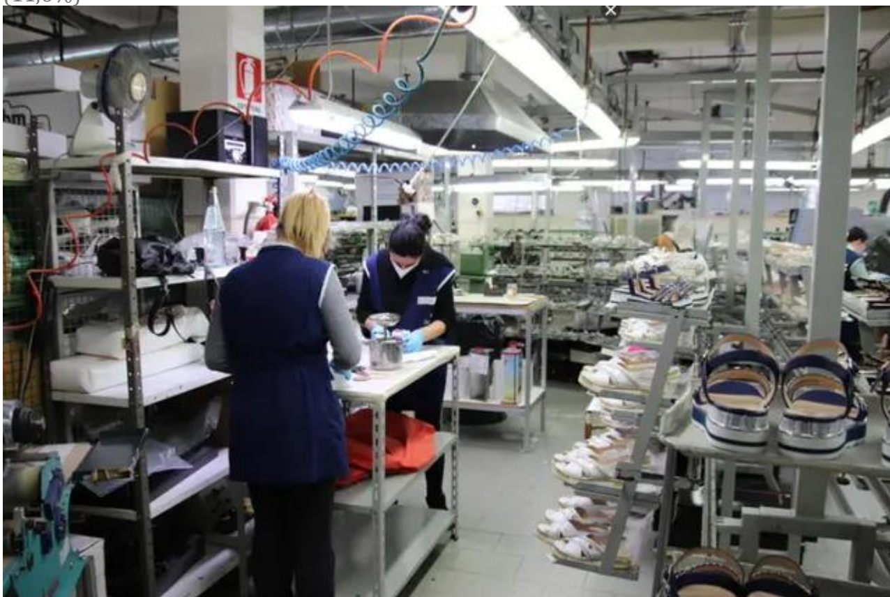
Un'azienda (immagine simbolo)

La maggiore concentrazione a Cagliari, forte la partecipazione femminile (27%) e giovanile (11,6%)